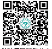
安徽省肿瘤医院微信公众号

医院服务理念 / 善待他人 幸福自己 尊重生命 关注细节 核心价值观 / 患者至上 关怀服务